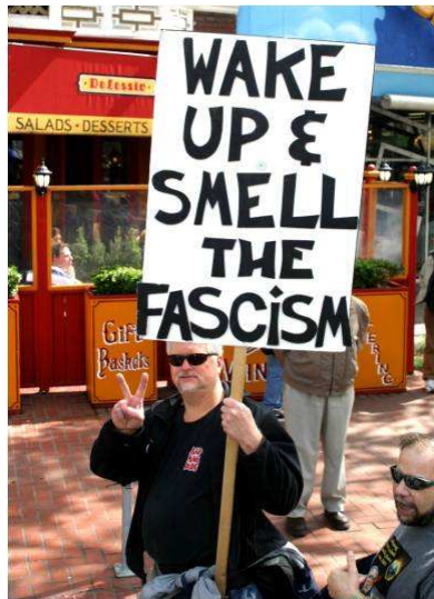
Obudź się i poczuj faszyzm

Teraz mamy “prawo międzynarodowe” nakładane na nasze zdrowie i ograniczające dostęp do naturalnych metod dbania o zdrowie. Oznacza to, że ci na czubku piramidy, czyli między innymi kartel farmaceutyczny, bezpośrednio ograniczają nam wybór i narzucają swoje zasady. „Wielki Farmaceuta” celuje we wszystkich i wszystko czego jeszcze nie kontroluje. „Wielki Farmaceuta” nie chce, aby ludzie odrzucili skalpel i leki farmakologiczne na korzyść innych terapii. ON, jeśli nie może czegoś zniszczyć (np. sklepów ze zdrową żywnością z suplementami diety i witaminami), to po prostu to wykupuje i zamienia na sieć podlegającą korporacji, która nie sprzedaje już więcej produktów o takiej jakości, jak poprzedni właściciel.