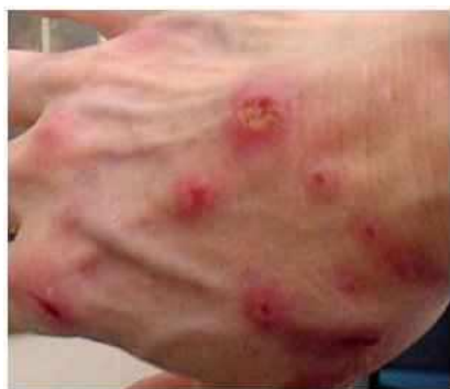
Lesions on person suffering from Morgellons disease

Straciła energię i miała kłopoty z pamięcią. Bolały stawy, zęby zaczęły się psuć, a włosy – wypadać. Czesząc się znajdowała na grzebieniu płataninę włosów, włókien i fragmentów tkanki. Nie wpuszczała nikogo do domu i przestała z niego wychodzić. Bała się, że nieznaną chorobą jest zaraźliwa. Opowiada, jak pewnego dnia z jej gałki ocznej wyszedł różowy robak i wykrztusiła muchę. – Pomyślałam, że się zabiję - mówi. Wizyta u dermatologa niczego nie wyjaśniła. Ale w internecie trafiła na opis objawów dokładnie takich samych jak jej własne i dołączyła do ponad 11.000 osób z całego świata, które twierdzą, że cierpią na nową chorobę. Niektórzy nazywają ją „chorobą włóknistą”, ale większość określa ją jako Morgellons. Nazwa pochodzi od opisanej w XVII wieku choroby, w której dzieciom wyrastały „szorstkie włosy”. W roku 2002 mieszkająca wówczas w Południowej Karolinie sfrustrowana matka, Mary Leitao, natrafiła na opis tej choroby w starej książce o historii medycyny - po tym, jak lekarze nie chcieli uwierzyć, że z wargi jej syna wyrastają włókna.